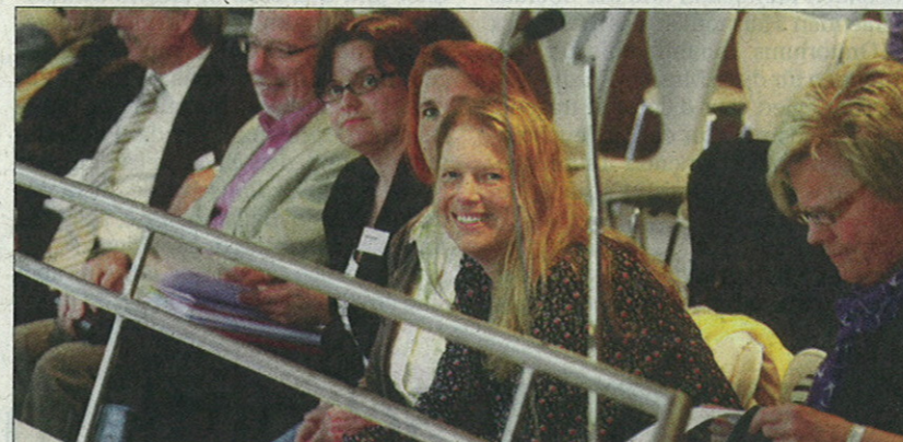
Die Mitarbeiterinnen der geriatrischen Reha-Klinik in Aalen atmen auf: Die meisten dürften wohl in der neuen Reha-GmbH Arbeit finden.