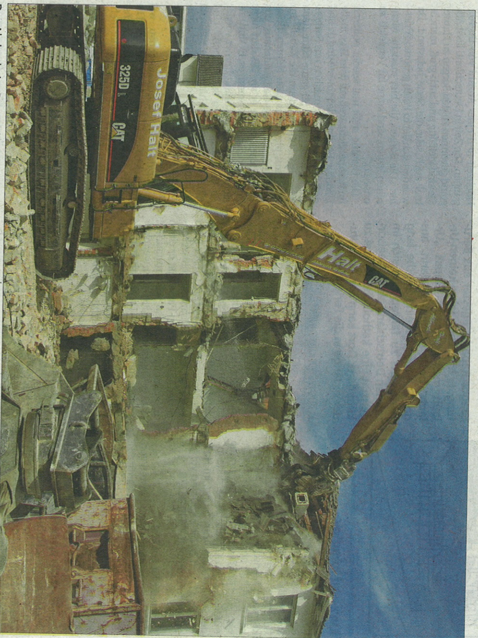
Der Abriss dreier Personalgebäude des Ostalbklinikums hat begonnen. Auf der frei werdenden Fläche soll ein vierstöckiger Neubau bis 2013 entstehen, in dem die Frauenklinik, die Kinderklinik und ein Labor Platz finden sollen.

Aufwändig wird der Abriss durch die verbindenden Strukturen, die zwischen Hauptgebäude, Personalgebäude und dem tiefer liegenden Gebäude des Bildungszentrums liegen. Heizungs-, Gas- und Stromleitungen zum Bildungszentrum mussten gekappt werden, um die